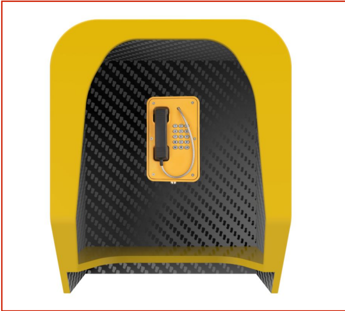
Campanas de teléfono