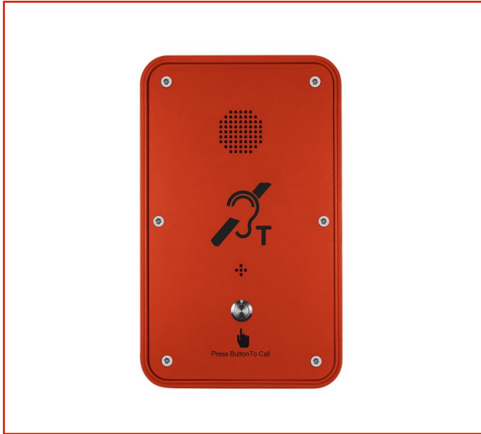
Teléfono resistente a la intemperie